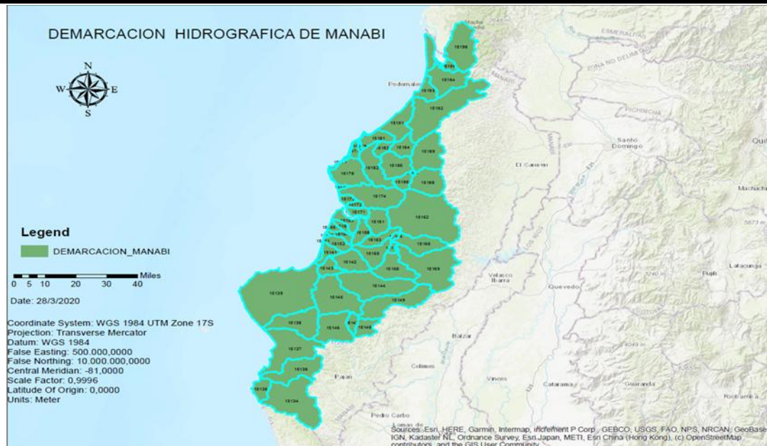
Figura 2. Demarcación Hidrográfica de Manabí

Según Quiroz et al. (2017), esta cuenca posee diversos tributarios, distribuidos en 74 esteros, 8 quebradas, 5 ríos y 3 micro cuencas principales (río Portoviejo, río Lodana y el embalse Poza Honda). La cuenca del río Portoviejo de acuerdo a Giler et al. (2020) es una de las cuencas que está dentro de la demarcación hidrográfica de Manabí. Está conformada por los cantones Portoviejo, Rocafuerte, Santa Ana y una parte del cantón 24 de mayo. La cual abarca un área total aproximada de 2.105,07 km 2 .