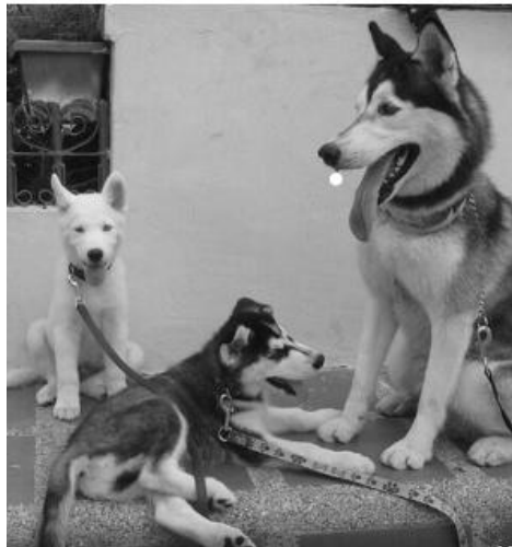
Figura 1: Mascotas con collares RFID